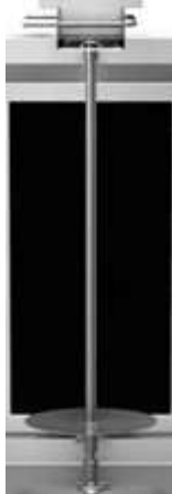
Шампур для шаурмы электрической OSBA 3.2S с приводом