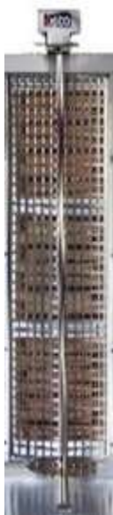
Шампур для аппарата шаурмы OSBA 3.3